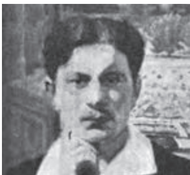
Fot. Katalag wystawy Władysława Mikosa

Między ul. Czesława Gołaszewskiego a Potokiem Malczewskim