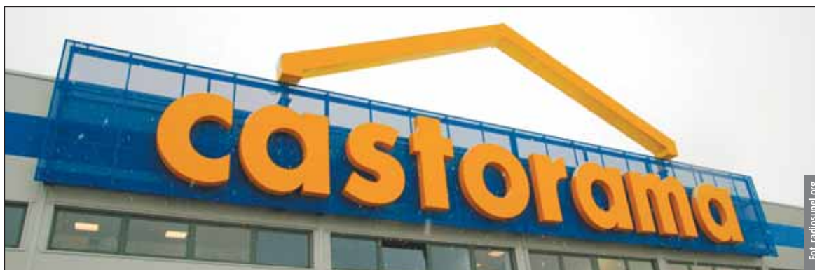
Inwestycja Castoramy to kolejny pomysł na zagospodarowanie blisko 40-hektarowego terenu

W każdym nowo otwartym sklepie spółka Castorama Polska zatrudnia na stałe ponad 100 osób. Aby zapewnić im właściwe kwalifikacje, przeprowadza szereg szkoleń, m.in. produktowych czy z zakresu obsługi klienta.