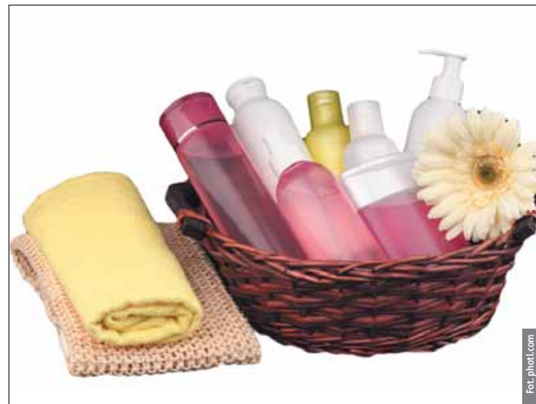
Zima to idealny moment, by rozprawić się z trądzikiem i łojotokowym zapaleniem skóry

Zima to idealny moment, by rozprawić się z trądzikiem i łojotokowym zapaleniem skóry. Najczęstszym sprzymierzeńcem pięknej cery prócz lasera jest kwas migdałowy