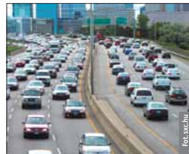
Algorytm może pomóc w rozładowaniu korków

Południowokoreańscy uczeni opracowali algorytm modelujący styl jazdy kierowców. Może on pomóc w rozładowaniu korków w ruchu miejskim oraz pomóc kierowcom dostosowywać prędkość, styl jazdy do warunków na drogach. O ich wynalazku poinformował portal ArXiv