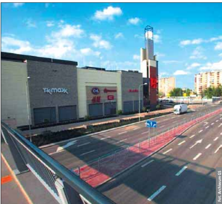
W galerii jest ponad 130 sklepów, punkty usługowe, kawiarnie i restauracje oraz kino