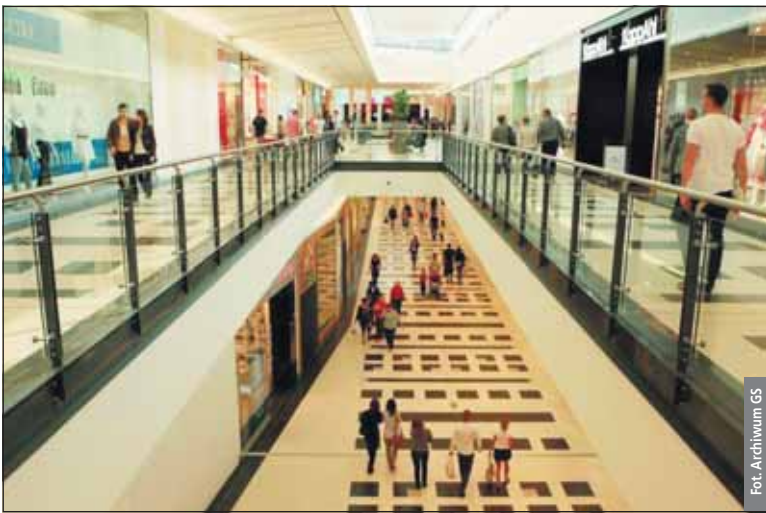
Dziennie ponad 16 tys. osób odwiedza Galerię Słoneczną