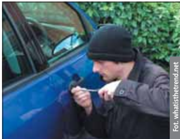
Najczęściej kradzionymi autami są wciąż Passaty i Golfy

Jeśli masz Volkswagena lub Audi, drżj. To ulubione marki polskich złodziei