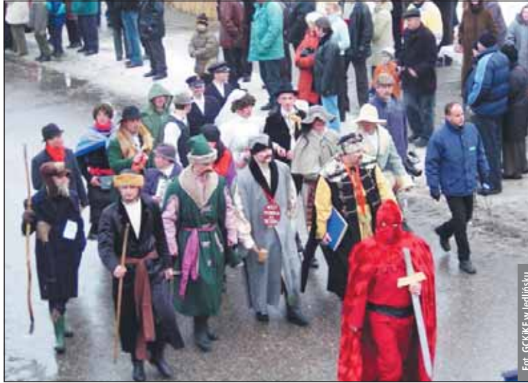
Kusaki rozpoczną się na rynku oficjalnie o godz. 13

JEDLIŃSK. Zbliży się jedno z najoryginalniejszych widowisk folklorystycznych w Polsce. Już 21 lutego Ścięcie Śmierci, czyli Jedlińskie Zapusty, zwane też Kusakami. Nasza redakcja objęła patronat medialny nad imprezą