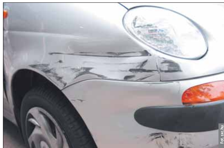
Są firmy, które pełne zniżki dają nawet za krótką historię jazdy bez szkody np. 3 lata

Wybrane oferty kredytów dla start-upów oraz kredytów inwestycyjnych. Dane Aspiro