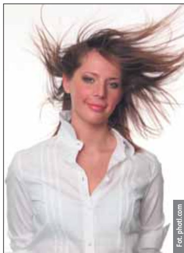
Im bardziej włosy są suche, czyste i mniej obciążone, tym częściej się elektryzują

której włosy zachowują naturalną wilgotność,